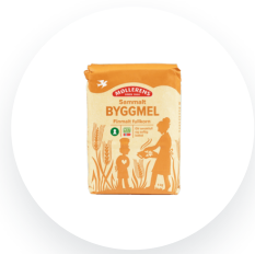
Møllerens Byggmel sammalt finmalt