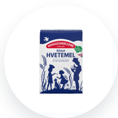
Norgesmø llene Hvetemel siktet