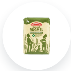
Møllerens Rugmel sammalt grovmalt