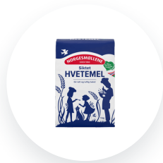
Norgesmøllene Hvetemel siktet